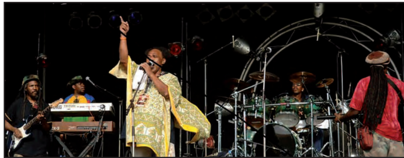
Figure emblématique de la culture musicale en Nouvelle-Calédonie, une "voix" de la radio, orateur hors pair, Jacques "Kiki" KARE, récemment disparu, était une personnalité incontournable. Ce film raconte l'itinéraire atypique de cet enfant du pays.